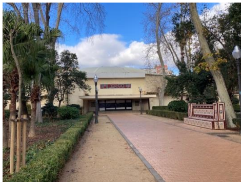
Pèrdua de la Pèrgola

Cal subratllar que dos de les pertorbacions han estat corregides, l'eliminació del parc de tràfic i la recuperació del Roserar. Així, l'última pertorbació que encara queda en peu és l'edifici de la Pèrgola.