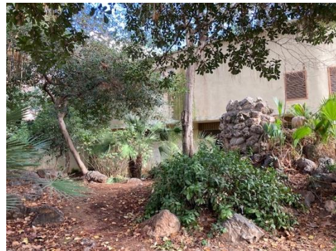
Destrucció de la muntanyeta