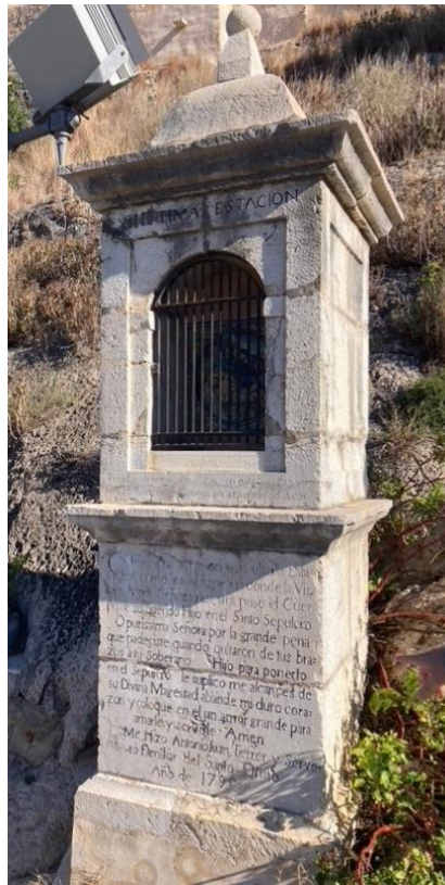
Restes i torres de l'Albacar Segon i Casalici de les Revoltes Noves

Cal dir que el grup format per les edificacions descrites gaudeix d'una qualitat paisatgística i històrica ben notable assolida per l'adició d'arquitectures tan diverses que recorren gairebé deu segles fent-ne una mena de secció transversal del temps.