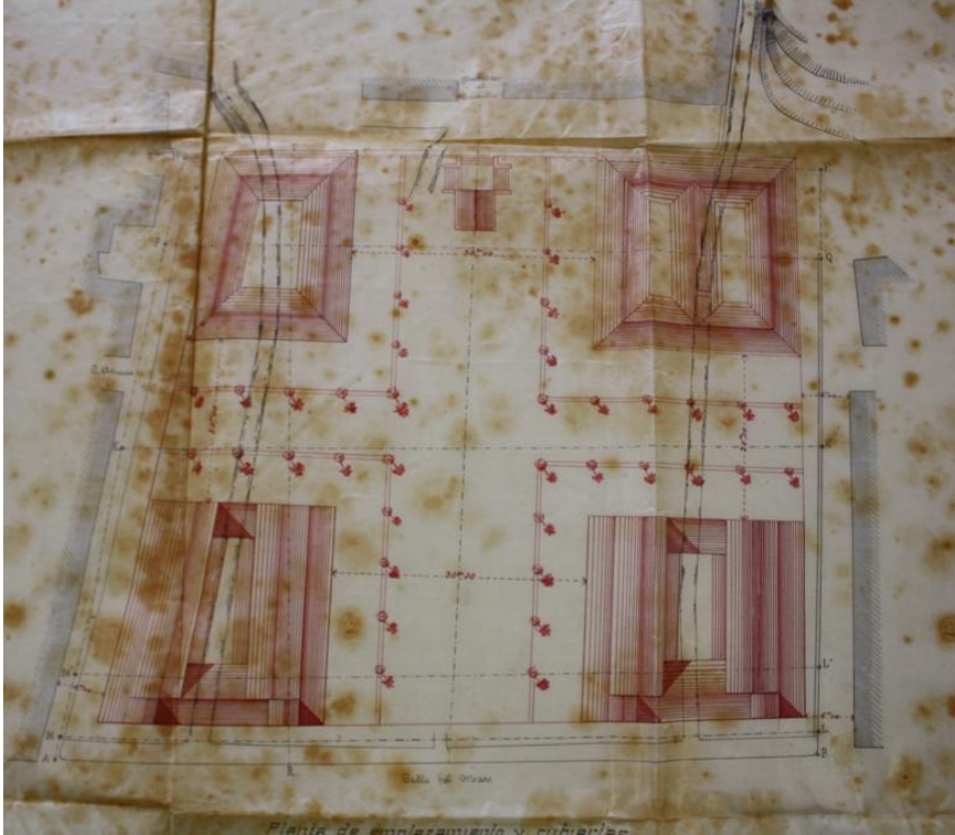
Plano de planta baixa del Mercat Municipal

El Mercat està catalogat com a Be de Rellevància Local.