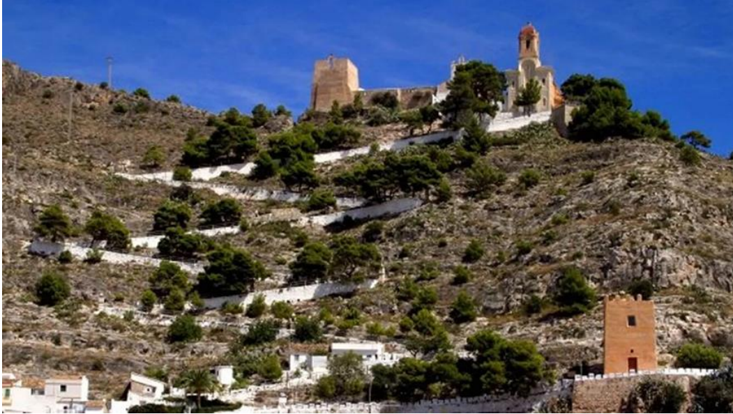
Vista de les Revoltes Noves, del Castell, del Santuari de la Verge i de la Torre de la Reina Mora

Les Revoltes Velles, de les que no queden més que les restes arqueològiques, eren el camí històric de pujada al Castell i fou en 1860 quan varen ser traçades i executades des Revoltes Noves, un ziga-zaga del tipus calvari de notable valors plàstics, ornat de casalicis divuitescos, de admirable factura, bastits al final del XVIII, amb llegendes gravades en la pedra picada i que abans estaven situats en la part baixa de les Revoltes Noves, molt agrupades, i ara es troben en cada colze del calvari.