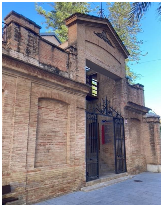
Accés a una de les naus del Mercat