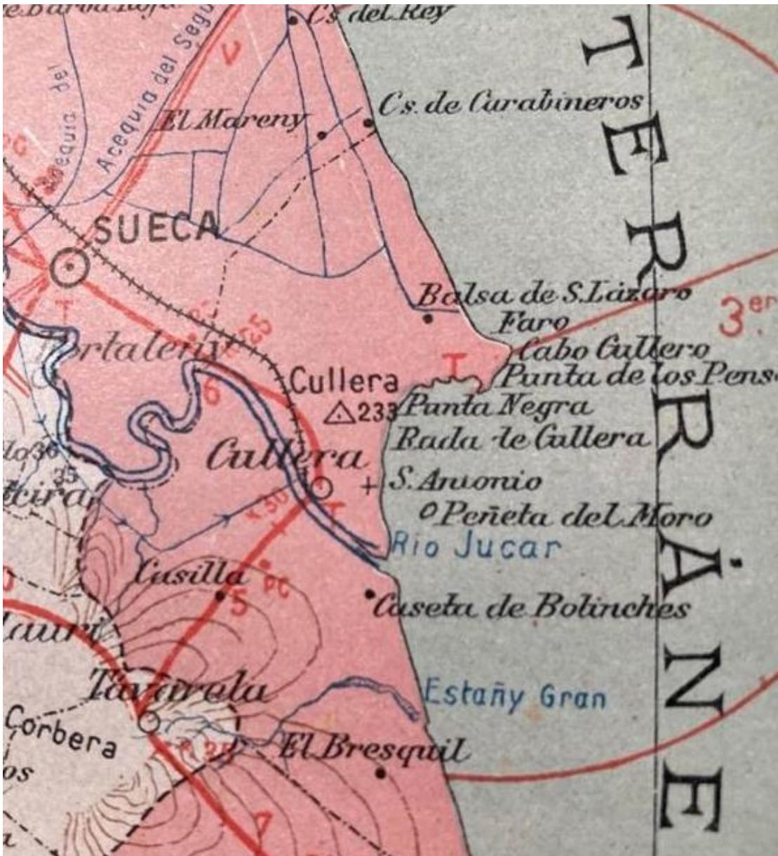
Geografía General de Valencia. Partido de Sueca 1/250000 3