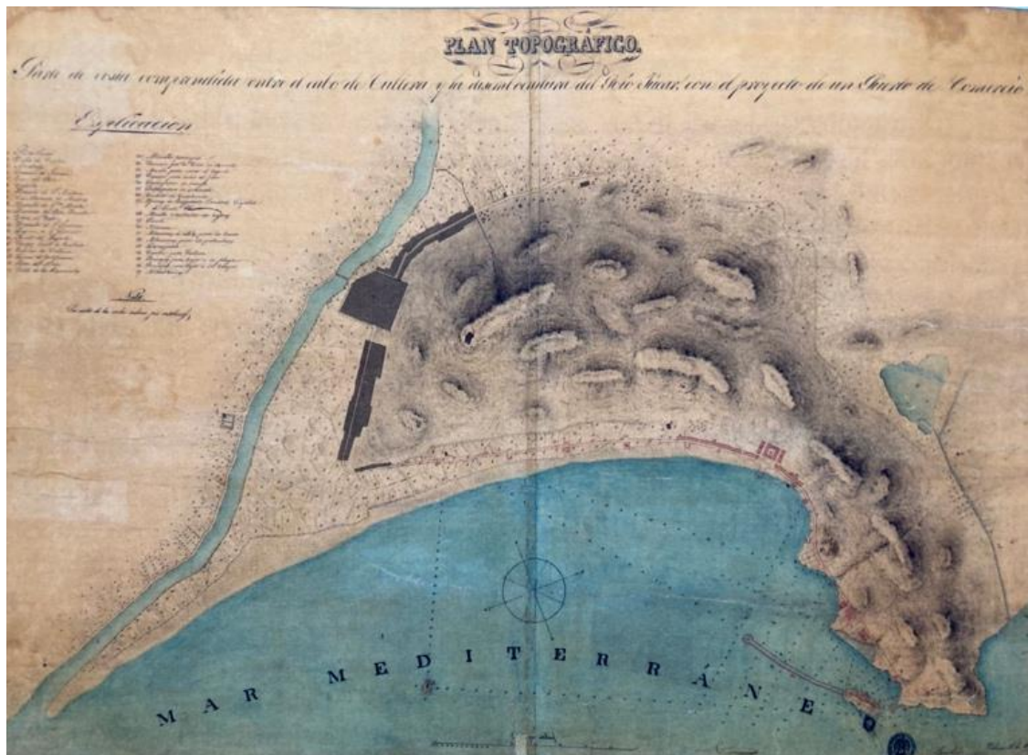
Plan Topográfico. Proyecto de un Puerto de Comercio. Lucio del Valle.1841

Caldria afegir a aquests tres elements un de situació submarina com és l'embarcador romà, situat a mitjan camí de la platja a l'escull de la balisa i que ha estat investigat pels arqueòlegs de l'Ajuntament de Cullera 5 .