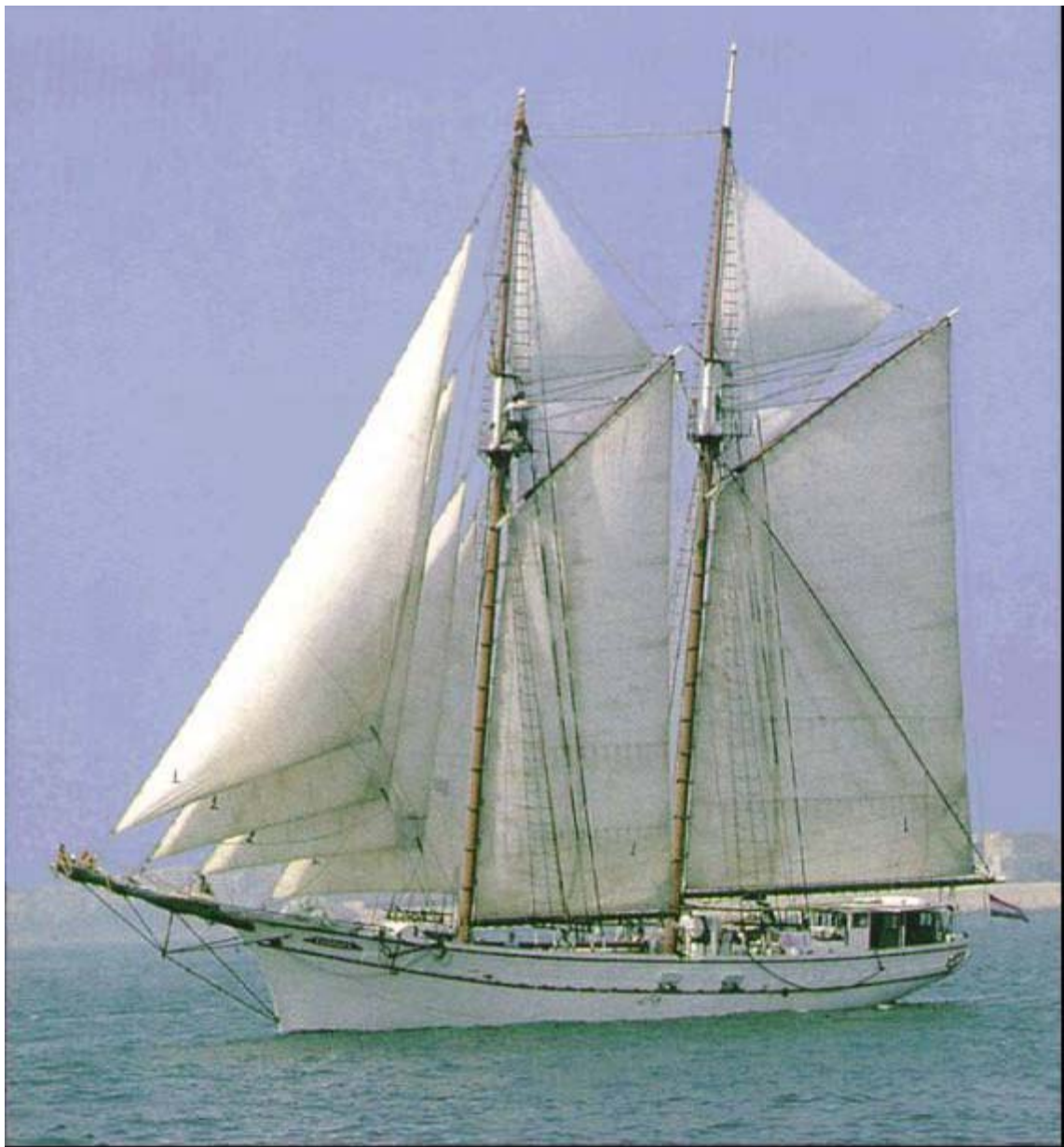
MOTOVELER CALA MILLÓ